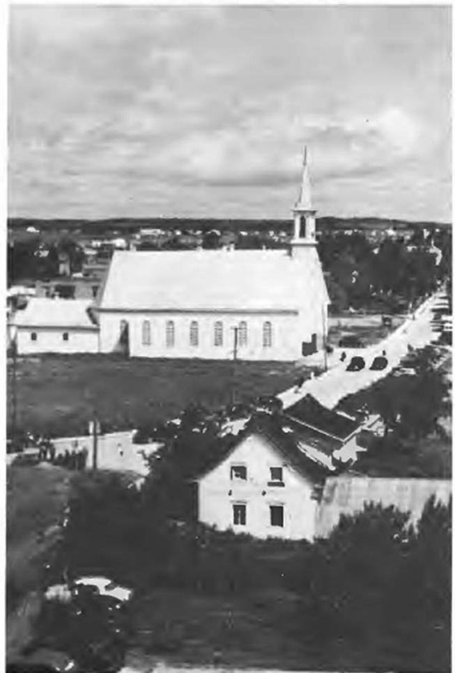
L'église de Notre-Dame de Roberval (construite en 1872) qui vient de disparaître.