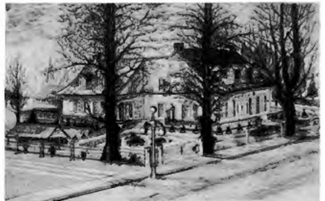
La Vieille Maison, d'après la carte de visite de J.-D. Guay.

Retiré de la politique municipale en 1902, il s'occupa de son journal et de son imprimerie. En avril 1904, pour accommoder les Soeurs du Saint-Sacrement, nouvellement arrivées à Chicoutimi et hébergées quelques semaines par les Soeurs du Bon-Conseil, il met à leur disposition la "Vieille maison", qu'il quitte pour loger avec sa famille à l'hôtel Château Saguenay dont il était propriétaire. Le 15 mars 1906, il reviendra dans la vieille propriété des Guay appelée la "Vieille Maison".