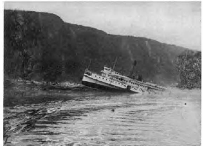
Le Carolina échoué sur la Passe-Pierre

Au mois de juillet 1964, le soussigné fut aimablement invité à dîner dans une famille de la Baie de Mille-Vaches (Saguenay). Au menu: une soupe aux herbes, à base de pierre et de “poulette grasse”.