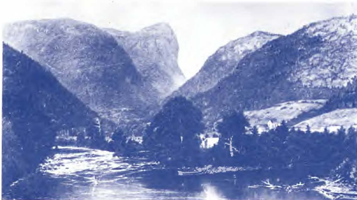
Embouchure de la rivière Petit-Saguenay, où fut installé la première scierie (1844), acquise et développée par Price.